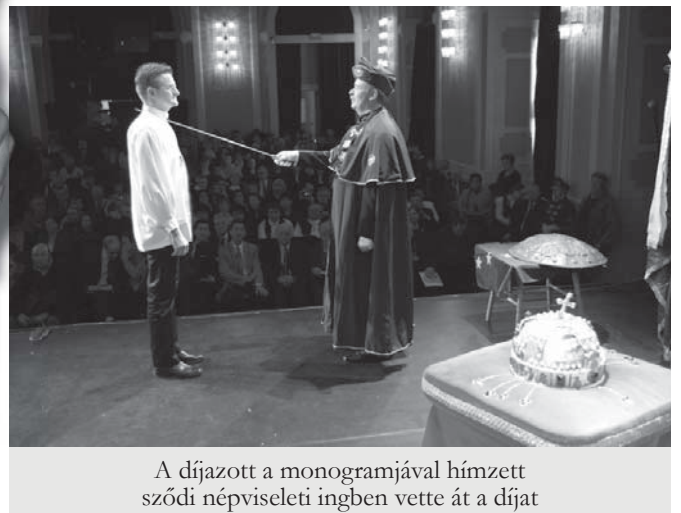
A díjazott a monogramjával hímzett szódi népviseleti ingben vette át a díjat