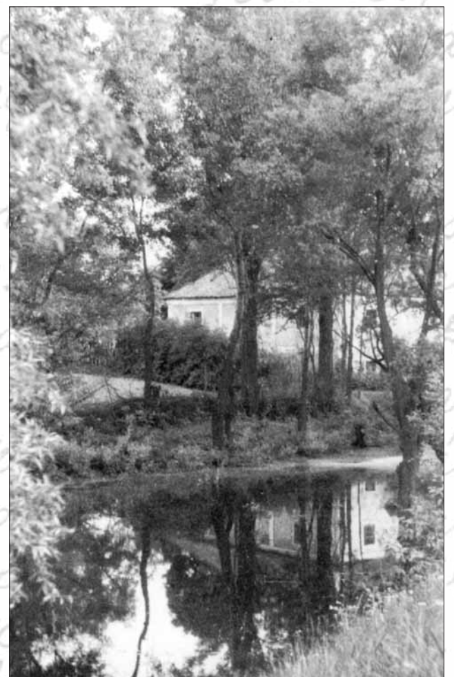
A szödrákosi malom korabeli látképe