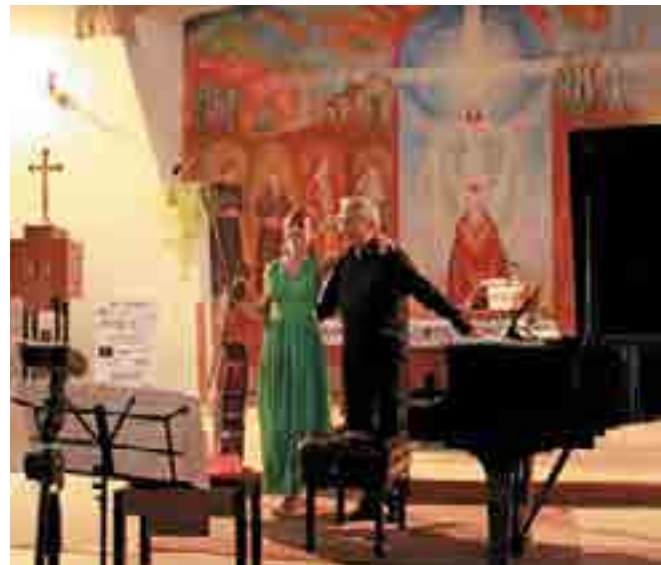
Apa és lánya ritkán adnak közös koncertet. Különleges alkalomnak lehetnek tanúi a gödiek