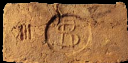
14. kép: „MD“ SzR III felirat = Szódrákos, LH: Vác, GY: Szalay I.