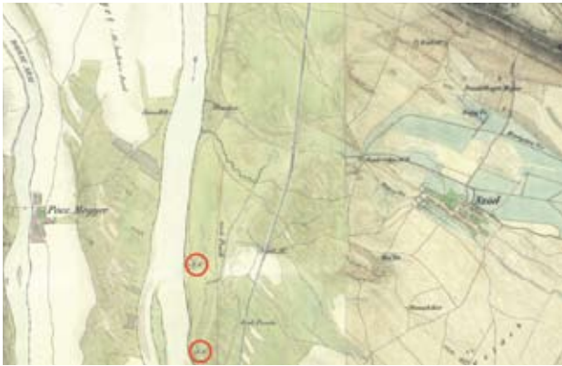
9. ábra: A második katonai felmérés térképrészlete