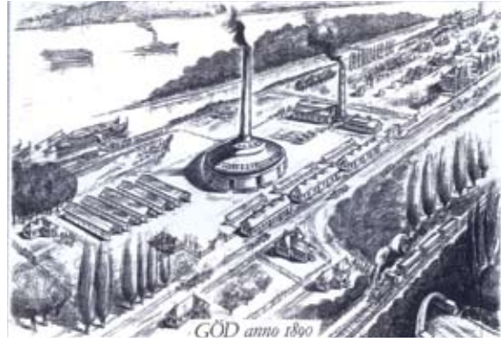
13. ábra: A gödi téglagyár