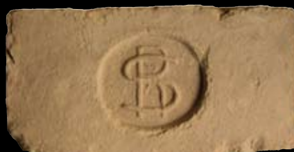
12. kép: „MD“ SzR felirat = Szódrákos, LH: Diósd, GY: Herczig B.