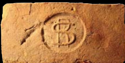
13. kép: „MD“ SzR felirat = Szódrákos, LH: Vác, GY: Szalay I.