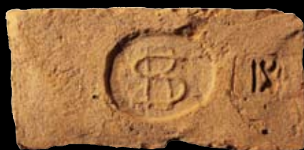
17. kép: „MD“ SzR IX felirat = Szódrákos, LH: Vác, GY: Szalay I.