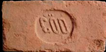
6. kép: „MD“ Göd felirat = Göd község, LH: Budapest, GY: Herczig B.