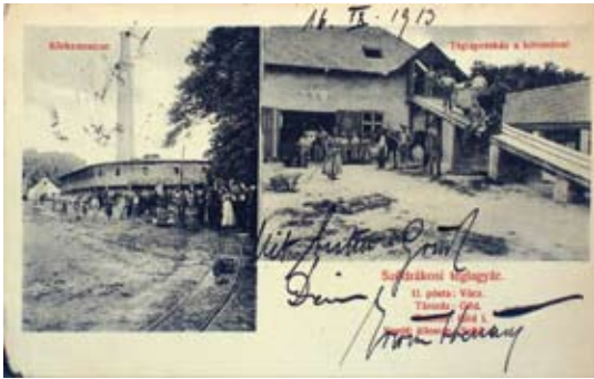
6. ábra: A szódrákosi gyár körkemencéje (1913)