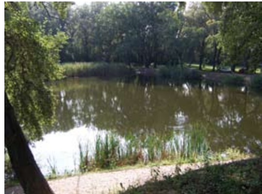
15. ábra: ... és ma