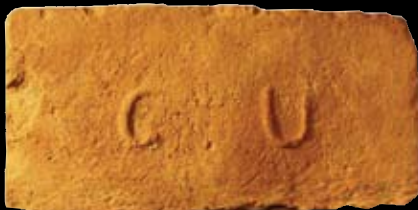
1. kép: „D“ GU felirat = Grassalkovich Uradalom, LH: Vác, GY: Szalay I.