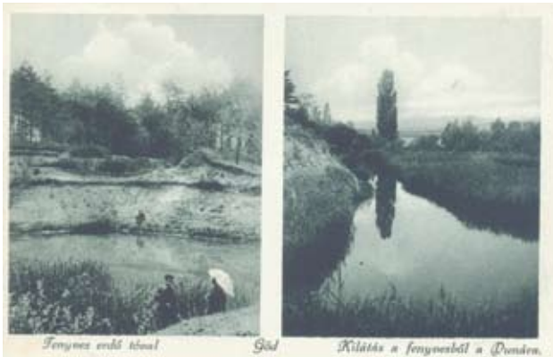
14. ábra: Az agyaggödör régen...

Az 1910-es térkép a területen már csak a kimerült bányagödrot és a hajdani gyár legnagyobb épületeit mutatja.