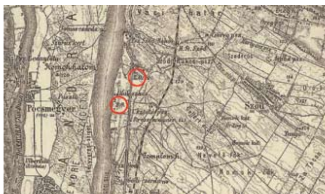
5. ábra: A harmadik katonai felmérés térképrészlete