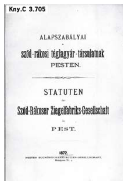
1. ábra: Társulati alapszabály (1872)

el. Az alapszabály külön pontban rendelkezett a pénztárvizsgálaton túl a köszénbányák 5 és téglagyárak külön megszemléléséről szóló jelentési kötelezettségről. A vállalat közvetlen vezetésére igazgatót alkalmaztak, akinek többek között feladata a pénztárzárlat, a beszerzések intézése, a téglá és az egyéb áruk árának meghatározása, a gyárak személyzetének felügyelete volt. Közgyűlést évente egyszer, májusban tartottak. Feladatául az előterjesztett üzleti jelentés elfogadását, a zárszámadást és az évi osztalék helybenhagyását, az igazgatótanács választását, a szám- és könyvvizsgáló bizottság választását, és a közgyűlés jegyzőkönyvének hitelesítésére két részvényes megválasztását határozták meg. A társulatot öt évre hozták létre. A társulás későbbi megszűnése okainak vizsgálatakor csak az alapszabályban rögzítettek adhatnak támpontot. Elképzelhető, hogy a részvényesek a feloslás mellett döntöttek, vagy alaptőke fele „veszteségbe ment”. A szabályzat végén megtalálható egy ideiglenes részvényeminta is (2. ábra). A társulat bélyegzőlenyomata és a fejléces levélpapírja a 3. ábrán láthatók.