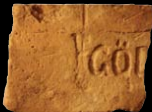
10. kép: „MM“ Göd felirat = Göd község, LH: Göd, GY: Szalay I.