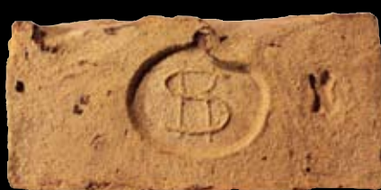
18. kép: „MD“ SzR X felirat = Szódrákos, LH: Vác, GY: Szalay I.