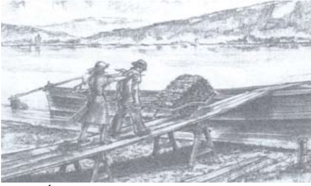
12. ábra: Így hordták fel az uszályra a téglát