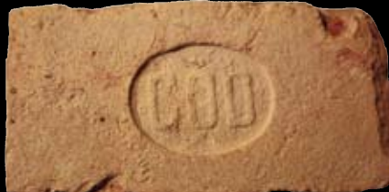
5. kép: „MD“ Göd felirat = Göd község, LH: Göd, GY: Szalay I.