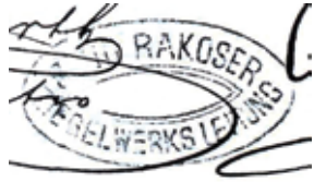
Szódrákosi téglagyár társulat. Sjöd Rákoser Ziegelfabriks-Gesellschaft.

3. ábra: A TéglagyárTársulat bélyegzőlenyomata és levélpapírja