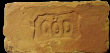
8. kép: „MM“ Göd felirat = Göd község, LH: Göd, GY: Volentics Gy.