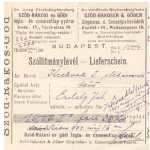
8. ábra: Szállítólevel 1904-ből

1910-ben F.-R. Alfréd a szódi plébánosnak írott levelében elszámolást tesz közzé, mely az alábbi leszállított tételeket tartalmazza: 1907-ben leszállított 4050 db téglá, darabonként 40 krajcárért (összesen 162 korona), 1908-ban 20 mázsa porosz szén 27 80 koronáért, 1909-ben két kubik darabos téglá 64 koronáért, valamint 1900 db gépi- és 1000 db első os-