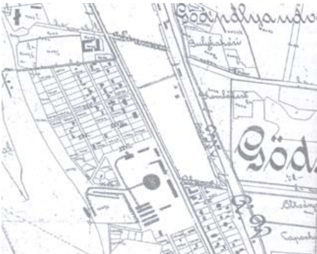
10. ábra: A gödi téglagyár elhelyezkedése

Borovszky Samu történész, Balázs Gábor levéltáros és több más forrás is 1900-ra teszi a gödi téglagyár-telep alapítását. Azonban egy másik forrás szerint 1897. július 15-én a gödi téglagyárban felkelés tört ki, 200 munkás sztrájkba lépett. A főszolgabíró szerint a munkabeszüntetés az előző vasárnap Kőbányán tartott szocialista kongresszus hatására robbant ki, ugyanis ezen az összejövetelen részt vetett a gödi gyár 4 munkása is. A gödi zendülés letörésére bevetették a Váci járás teljes csendőrállományát, azonban a téglagyári munkások mozgalma három hét múlva már országossá terebélyesedett. 36 A felkelésnek szociális, gazdasági okai lehettek. Olyannyira alacsony volt a téglagyári dolgozók bére, hogy abból ruházódásukra is alig telt. Mint arról a váci sajtó 1888 januárjában beszámolt a sződrákosi téglagyár egy munkása miközben Vácról az órányi járásra lévő gyár melletti szállására igyekezett keze elfogytak. Kezelésre a budapesti Rókus kórházba kellett szállítani. 37