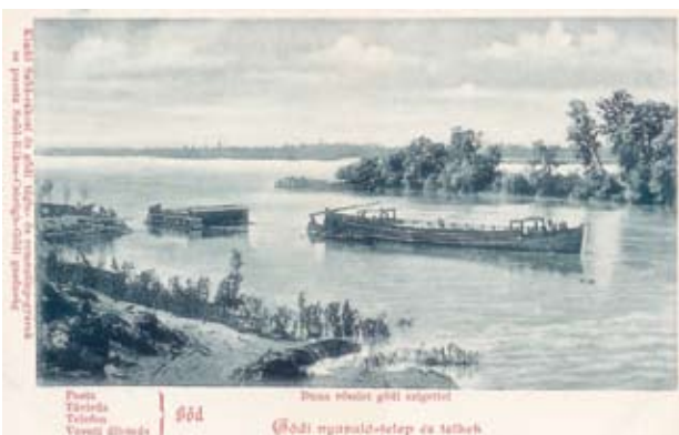
11. ábra: A gödi kikötő uszályal, az előtérben agyaghalmokkal

Borovszky Samu történész, Balázs Gábor levéltáros és több más forrás is 1900-ra teszi a gödi téglagyár-telep alapítását. Azonban egy másik forrás szerint 1897. július 15-én a gödi téglagyárban felkelés tört ki, 200 munkás sztrájkba lépett. A főszolgabíró szerint a munkabeszüntetés az előző vasárnap Kőbányán tartott szocialista kongresszus hatására robbant ki, ugyanis ezen az összejövetelen részt vetett a gödi gyár 4 munkása is. A gödi zendülés letörésére bevetették a Váci járás teljes csendőrállományát, azonban a téglagyári munkások mozgalma három hét múlva már országossá terebélyesedett. 36 A felkelésnek szociális, gazdasági okai lehettek. Olyannyira alacsony volt a téglagyári dolgozók bére, hogy abból ruházódásukra is alig telt. Mint arról a váci sajtó 1888 januárjában beszámolt a sződrákosi téglagyár egy munkása miközben Vácról az órányi járásra lévő gyár melletti szállására igyekezett keze elfogytak. Kezelésre a budapesti Rókus kórházba kellett szállítani. 37