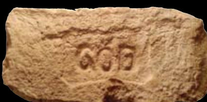
9. kép: „MM“ Göd felirat = Göd község, LH: Göd, GY: Menyhárt M.