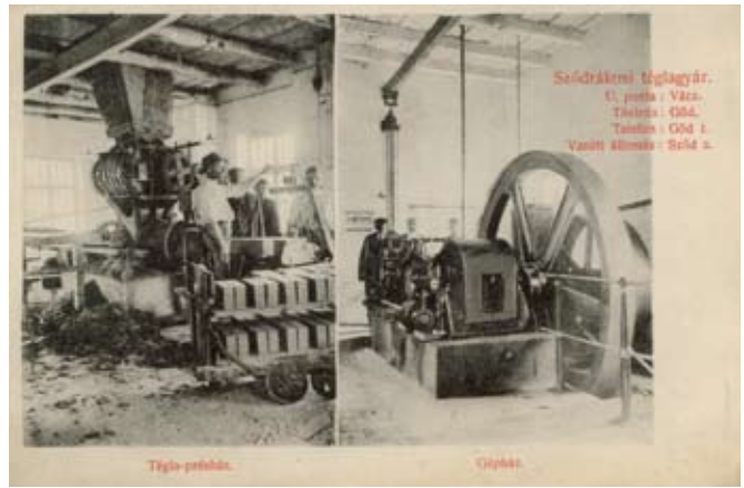
7. ábra Téglaprésház Szódrákoson

fénykorában működött. 22 1885-ben az országos kiállításon éremmel lett kitüntetve a gyár. A közel ötven évig működő gyárban gyártott termékek: kézi téglá, géptéglá, tetőcserép, burkolattéglá, kúpcerép, kút- és csatornatéglá voltak. A gyár területe kb. 100 hold volt. Az épületek gyáranként: egy-egy modern, 1858-ban szabadalmaztatott Hoffmann-féle körkemence (6. ábra), téglaprésház gépházzal (7. ábra), irodaépület, lakóházak, szárítók. A hajtóerőt a préshajtáshoz 35 lóerős szívógázmotor, a víz- és villanyhoz 4 lóerős benzinmotor és 2 lóerős szivattyú, valamint egy 7 lóerős bányaszivattyú biztosította. Évi termelési kapacitása 4-5 millió téglá volt. A milleniumi építkezések idején a termékek Budapesten és Újpesten kerültek értékesítésre. 23 Az ipar elképesztő munkaerőigénye miatt a 19. század végére a főváros lakossága 250 ezerről 700 ezerre emelkedett. A megnövekedett népesség bérkaszárnnyáinak építéséhez ekkor rengeteg téglára volt szükség.