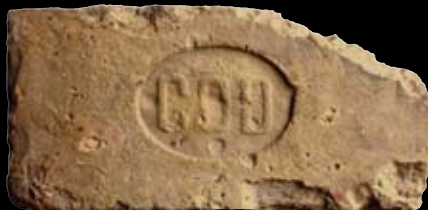
4. kép: „MD“ Göd felirat = Göd község, LH: Tát, GY: Herczig B.