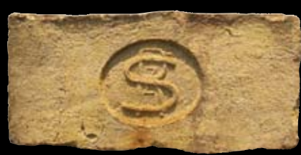
11. kép: „MD“ SzR felirat = Szódrákos, LH: Sződ, GY: Volentics Gy.