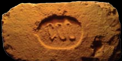
7. kép: „MD“ Göd felirat = Göd község, LH: Göd, GY: Menyhárt M.